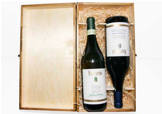
Wein in edler, dunkelbrauner Holzschatulle mit Verschluss, wahlweise mit ein oder zwei Flaschen.