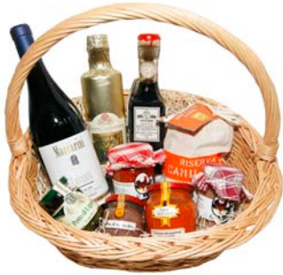
Klassischer Geschenkkorb, individuell bestückbar ab 20,00€

Egal zu welchem Anlass - ob Weihnachten, Geburtstag oder einfach aus Freude am Schenken - hier können Sie individuell nach Ihrem Geschmack Genuss verschenken. Ob eine gute Flasche Wein in einer edlen Holzkassette oder verschiedene Leckereien nach Ihren Wünschen zusammengestellt im klassischen Geschenkkorb - es findet sich für jeden Anlass und Geschmack das Passende.