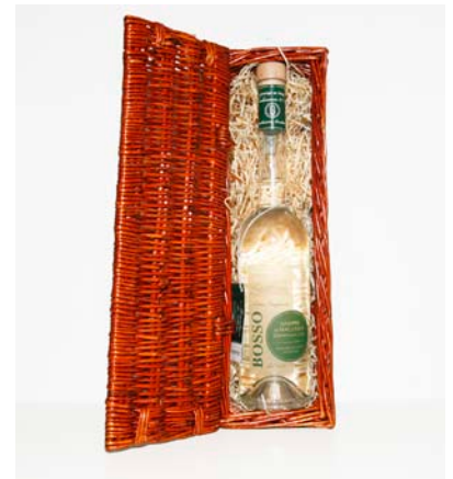
Grappa im Weidenkorb